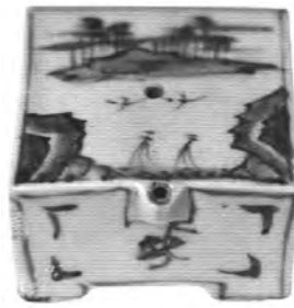
◀청화백자산수문연적 조선 후기 높이 7.9cm

지난 21일 덕암세미나실에서 진행된 불교 문화연구원 주최 학술세미나 '희망의 생태학, 길도 숲도 필요하다'의 발제문 중 김종욱(불교학) 연구교수의 '농업적 생명, 산업적 생명 그리고 불교생태학적 생명'을 정리해 보았다. 편집자