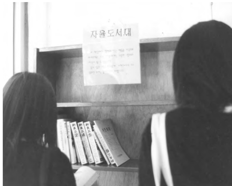
‘함께봅시다’... 사범대 교학과는 학생들의 원활한 도서교류를 위해 학림관 1층에 ‘자율도서관’을 설치했다. 단행본, 잡지, 교재 등 다양한 종류의 책을 자유롭게 공유하는 계기가 될 것으로 기대된다.