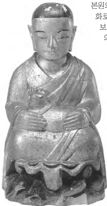
◀목조나한상 조선 후기 높이 42.5cm

이번 개교 98주년 기념 특별전은 다음달 11일까지 열릴 예정이며, 박물관은 앞으로 개교 100주년을 맞이하는 2006년도에 학교역사자료를 중심으로 백주년기념사업본부와 함께 전시전을 마련할 계획이다.