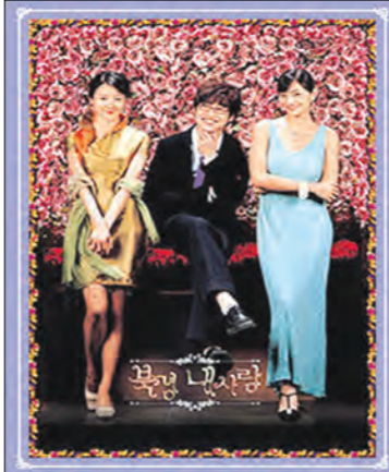
한국과 중국 젊은이들의 사랑과 일을 주제로 제작된 한·중 최초 합작 드라마.

멋진 외모와 풍족한 재력, 거칠 것 없는 성격으로 작업(?)만 일삼던 재벌집