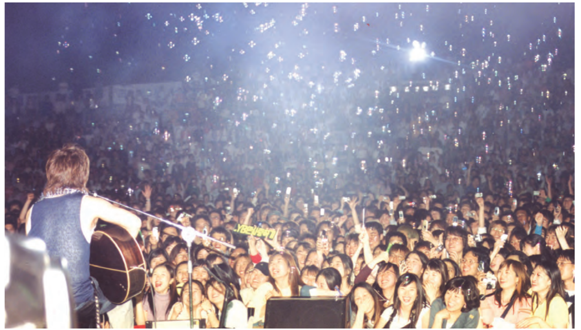
대동과 환희 ... 지난 19일 저녁 총학생회(구자룡·아간영문4) 주최로 열린 대동한마당에는 4천여명의 학생들이 만해광장을 가득 메워 대동의 장을 마련했다. 특히 이날 마지막 순서였던 윤도현 밴드의 공연은 모든 관객이 하나가 된 환희의 장이기도 했다.