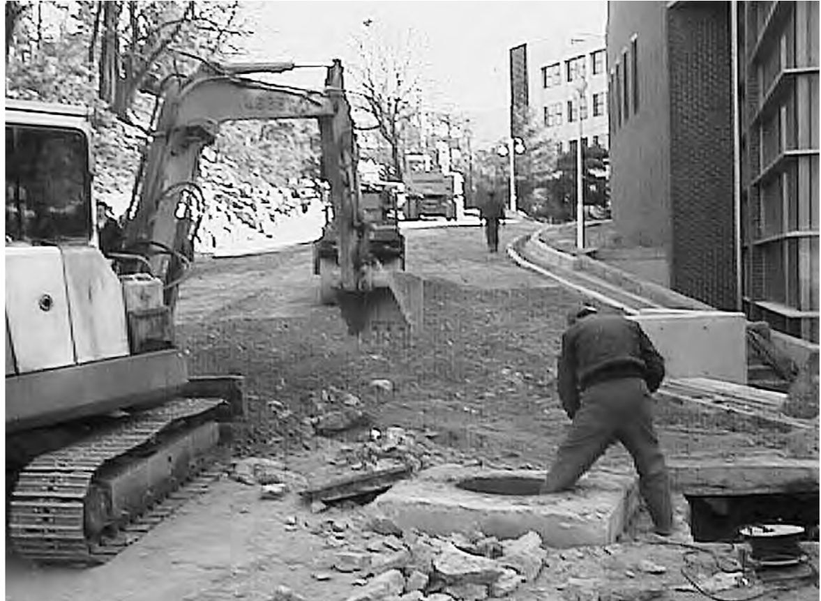
마무리... 97년 8월 기공식 이후 정보매체센터 건설공사가 마무리 단계에 접어들고 있다. 지난 20일 정보매체센터 앞길의 포장을 위한 작업이 진행되고 있다.

한편, 구체적인 시험일정은 22일 장충체육관에서 열릴 신입생 오리엔테이션에서 전달된다. 이와 관련해 취업과의 한 관계자는 "학생들의 많은 참여를 바란다"고 말했다.