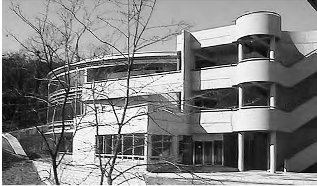
완공... 지난해 3월부터 시작돼 근 1년동안의 공사를 마친 룸비니관이 오늘(22일) 개관한다. 학생식당을 비롯한 여러 복지시설을 갖추고 있어 학내 복지향상에 기여할 것으로 기대된다.

떨었지만 우선 부모님께 감사드리고, 지금 행정고시 준비를 하고 있는데 열심히 노력해서 좋은 결과가 있도록 하겠다"고 수상소감을 말했다.