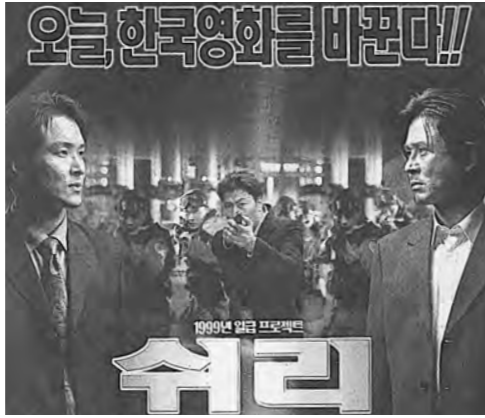
'쉬리'는 한국형블록버스터 액션영화의 출현을 가능케한다. '쉬리'의 미덕은 많다. 우선 '장군의 아들' 이후 '게임의 법칙' '광개수염' '남버 3' 등 뒷골목 강패들의 세계가 전부였던

“분단 상황에 대한 다양한 장르적 접근은, 우리의 현실을 영화를 통해서 되짚어보는 중요한 계기가 될 것이다”