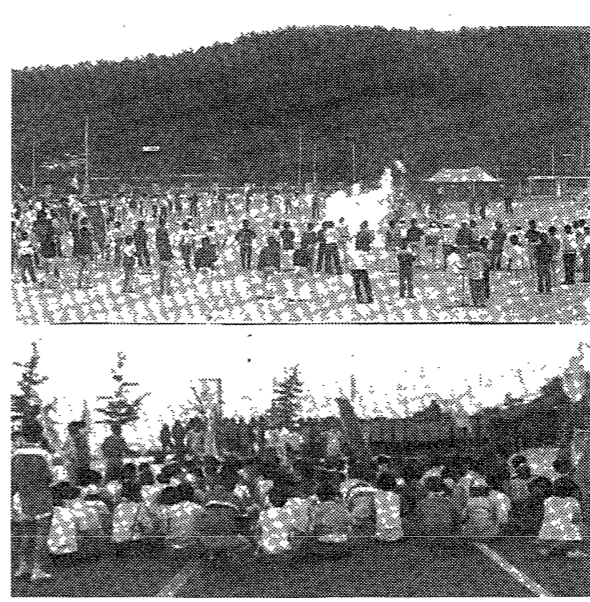
○慶州컴퓨터「87학삼제전」이 축하생회 주최로 지난달29, 30일 양일간 교내일원서 펼쳐졌다.

참여저조 여실히 드러내 공동체의식 高揚 아쉬워 【경주 13일 특파원 김기현 기자】 慶州대학에서 열린 「87학삼제전」이 축하생회 주최로 지난 달 29, 30일 양일간 교내 일원서 펼쳐졌다. 그러나 학생들의 참여가 저조하여 아쉬워하고 있다. 축하생회는 이번 삼제전을 통해 학생들의 공동체 의식을 고취시키고자 했으나, 실제로는 학생들이 적극적으로 참여하지 않아 아쉬움을 표하고 있다. 특히 예년의 판정시비와 같은 학생들의 자발적인 참여가 줄어들었다는 점이 주목된다. 축하생회 관계자는 "학생들의 참여가 저조한 것은 공동체 의식이 부족하기 때문"이라며, 앞으로는 학생들의 자발적인 참여를 유도할 방침이다.