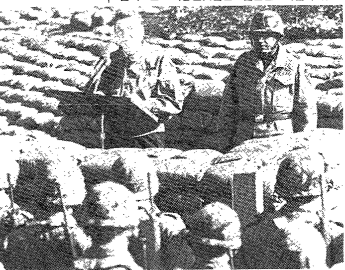
미국과 제3세계 군부와의 연계성에 대한 논의를 보여주는 사진. 군부지원세력의 근본통해 실현을 위한 노력의 일환으로 촬영되었다.