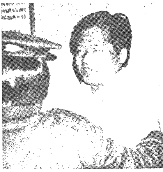
한국의 정치범들에 있어서는 정치권력의 政敵 탄압이 라는 인상이 이룩감하다.