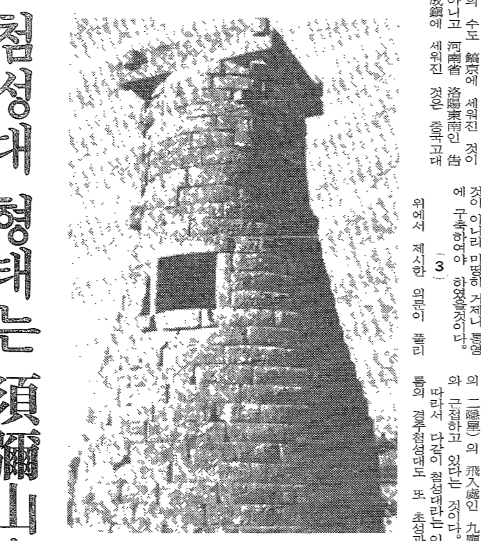
첨성대(天文觀象臺)의 정체를 알아본다

첨성대의 건축 양식은 고구려의 전통적인 건축 양식을 따르고 있다. 첨성대의 구조는 10층의 탑으로, 각 층의 면적이 위에서 아래로 갈수록 넓어진다. 첨성대의 높이는 약 28미터로, 고구려의 건축 기술의 발달을 보여주는 중요한 유적이다. 첨성대의 건축 양식은 고구려의 전통적인 건축 양식을 따르고 있다. 첨성대의 구조는 10층의 탑으로, 각 층의 면적이 위에서 아래로 갈수록 넓어진다. 첨성대의 높이는 약 28미터로, 고구려의 건축 기술의 발달을 보여주는 중요한 유적이다.