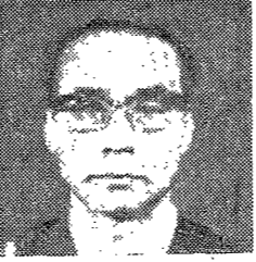
인도의 후먼리즘을 연구한 학자

인도의 후먼리즘은 서양 후먼리즘의 영향을 받아서 형성된 것으로서, 그 뿌리를 찾아볼 때 고대 그리스 로마의 후먼리즘, 17세기 프랑스의 후먼리즘, 그리고 19세기 독일의 후먼리즘을 들 수 있다. 그러나 인도 후먼리즘은 이들 후먼리즘과 달리, 고대부터 존재해 왔던 인도 철학의 전통 속에서 형성된 것이다. 인도의 후먼리즘은 고대부터 존재해 왔던 인도 철학의 전통 속에서 형성된 것이다. 고대 인도 철학의 전통 속에서 형성된 것이다. 고대 인도 철학의 전통 속에서 형성된 것이다.