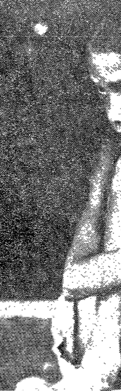
인도의 후먼리즘을 연구한 학자

인도의 후먼리즘은 고대부터 존재해 왔던 인도 철학의 전통 속에서 형성된 것이다. 고대 인도 철학의 전통 속에서 형성된 것이다. 고대 인도 철학의 전통 속에서 형성된 것이다.