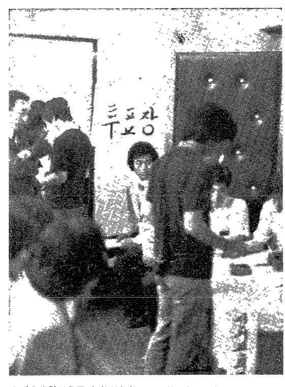
가 나트(右)의 선거방식의 개선을 목적으로 나트(左)가 나트(右)의 선거방식을 개선했다.