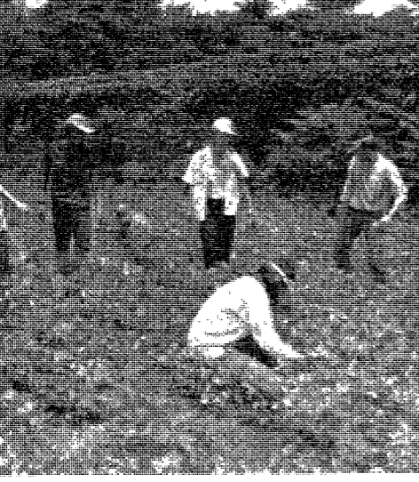
△하계봉사활동이 그후연에서는 다양해졌으나 학생들의 참여저조로 계획대로 진행시키기 어렵게 됐다.

학부별 활동은 즉시대로 진행되지 못했으며, 이는 학생들의 참여를 저해하고 있다. 학부별 특성에 맞는 활동을 추진해야 한다는 주장이 제기되었다.