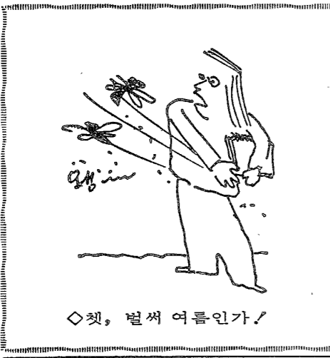
◇셋, 벌써 여름인가!