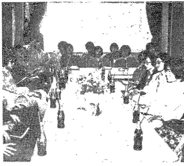
△지난 9일, 교수식당에서 한국단·씨클장의 간담회 열렸다.