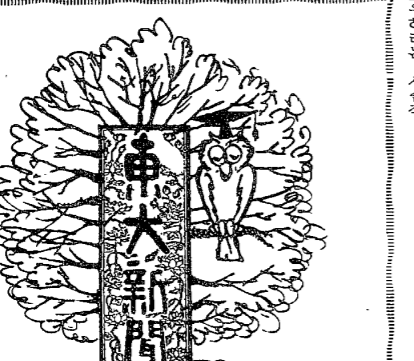
正論으로 자란 31년