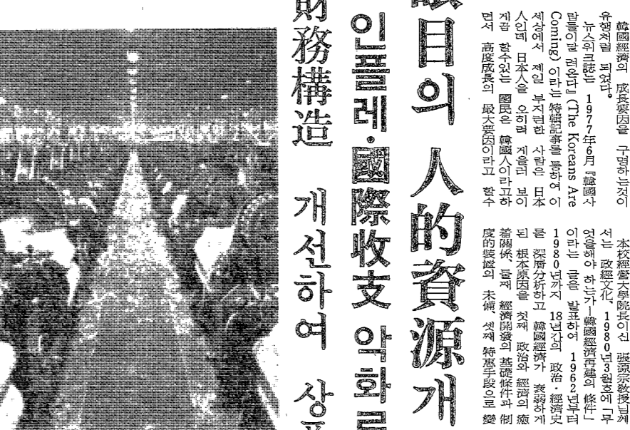
4차 경제개발 5개년 계획의 시작점으로 77년 10월 15일 100일대회를 개최한 장면

長期眼目의 人的資源개발이 成長의 關鍵... 企業, 財務構造 개선하여 生産性 높여야 할 때