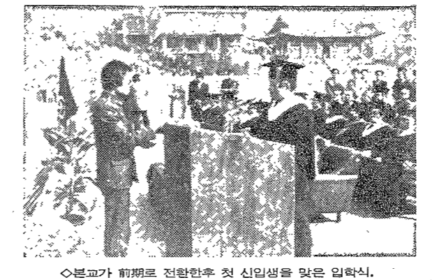
본교가 前期로 전환한후 첫 신입생을 맞은 입학식

鄭總長 "사명감 갖고 勉學해야" 鄭總長 "사명감 갖고 勉學해야" 鄭總長 "사명감 갖고 勉學해야" 鄭總長 "사명감 갖고 勉學해야"