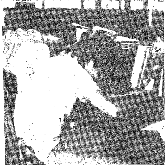
한성활동活性化 위해 심사의 寬容 있기를...

한성활동活性化 위해 심사의 寬容 있기를... 대학은 학생들의 창의성을 발휘할 수 있도록 심사에 寬容을 보여야 한다. 특히, '가난'과 '빈곤'을 극복하고 '부유'와 '번영'을 향유하는 데 있어 대학이 어떤 역할을 해야 하는지를 고민하고 있다.