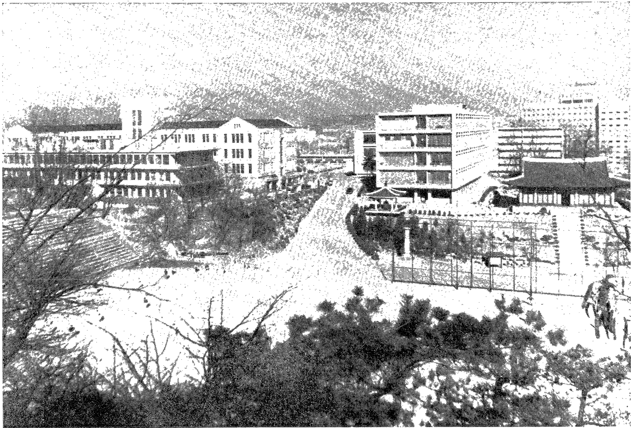
◇사진=林翼斗 記者【Nikon F2·28mm·F16·1/30·ASA 400】