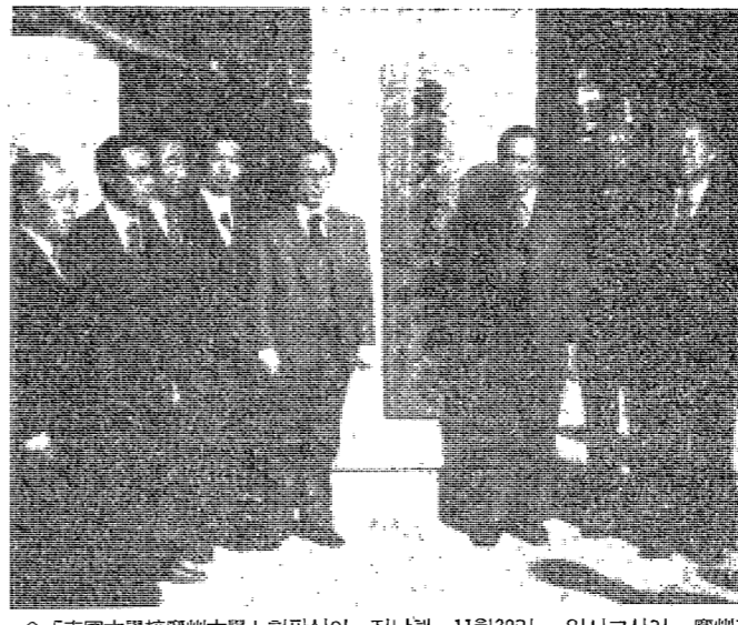
「東國大學校慶州大學」 聯合식이 지난해 11월 29일 入學교사인, 慶州高等學校에서 있었다.