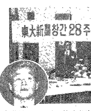
本紙創刊 28주년 祝賀宴

各種 學生活動 活潑. 修練會 등 통해 放學善用. 修練會 등 통해 放學善用. 修練會 등 통해 放學善用.