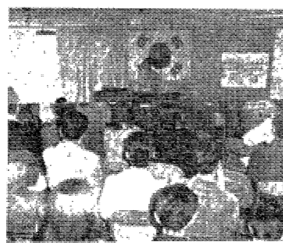
학부 학생들과 교직원들의 단체 사진

不實의 豫算編成. 第2期學斗豫算額을 보고. 예산 편성이 현실과 맞지 않는다는 지적. 교육 예산의 낭비와 비효율성에 대한 우려가 커지고 있다.