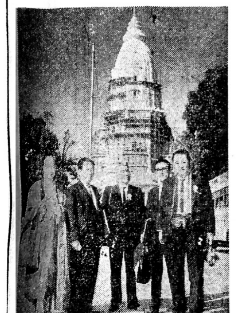
【本報記者 李箕永 東京八日電】第七次世界佛敎徒大會의 豫備會議이 1월 7일(日)에 성공적으로 끝났다. 이 회의는 1월 5일부터 7일까지 열렸으며, 28개국이 참가했다. 이 회의는 세계佛敎徒大會의 7차 대회로서, 1952년 인도 사르나트에서 열린 이래로 12년 만에 다시 열리고 있다. 이 회의는 세계佛敎徒大會의 7차 대회로서, 1952년 인도 사르나트에서 열린 이래로 12년 만에 다시 열리고 있다.